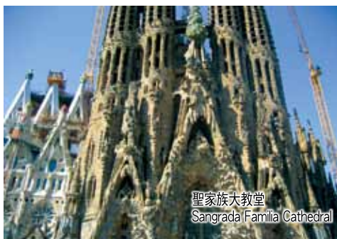
聖家族大教堂 Sagrada Familia Cathedral