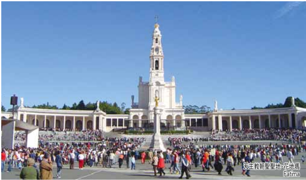
天主教朝聖聖地-花地瑪 Fatima