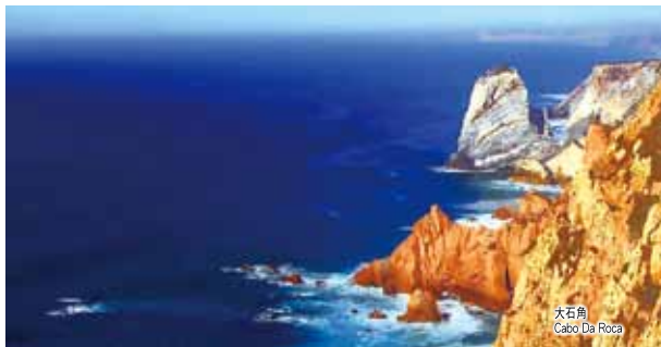
大石角 Cabo Da Roca