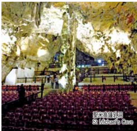
聖米高鐘乳洞 St Michael's Cave

住宿：NH Hotel 或同級 (早、午餐) A visit to the Royal Palace with its lovely chambers, banquets, paintings and sculptures is a must. Afterward, coach to Segovia, also an ancient capital where the Roman aqueducts in Europe are best preserved. Return to Madrid for shopping at Puerta in late afternoon. (B/L)