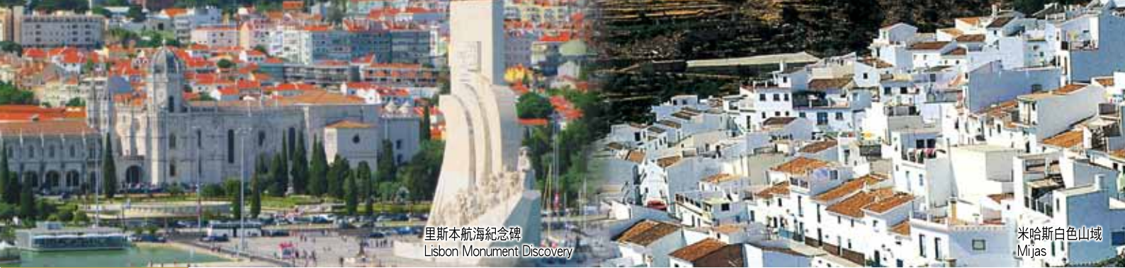
里斯本航海紀念碑 Lisbon Monument Discovery