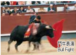
鬥牛表演 Bull Fight

Head south for Gibraltar. Upon arrival, transfer to the city center to visit St. Michael Cave. Later on, proceed along the coastal line to Costa Del Sol, the famous beach resort south of Spain, with a brief stop at Mijas,