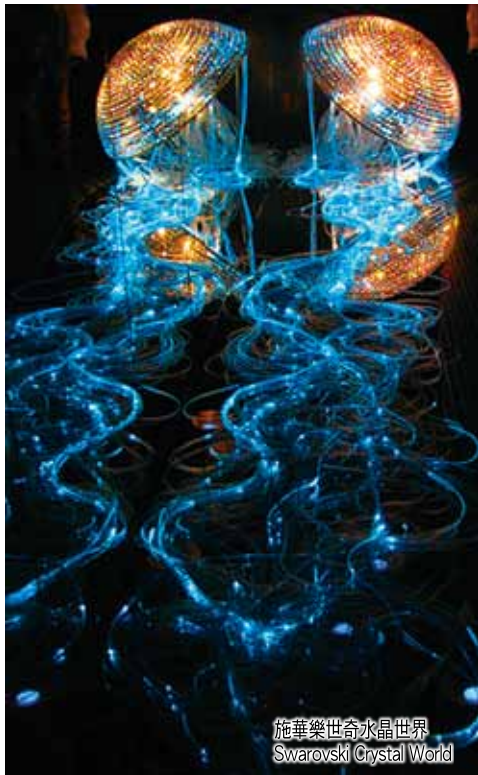
施華樂世奇水晶世界 Swarovski Crystal World