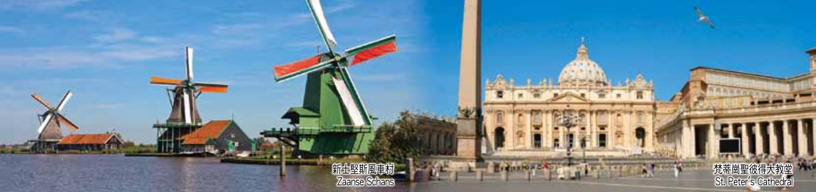
新士堅斯風車村 Zaanse Schans