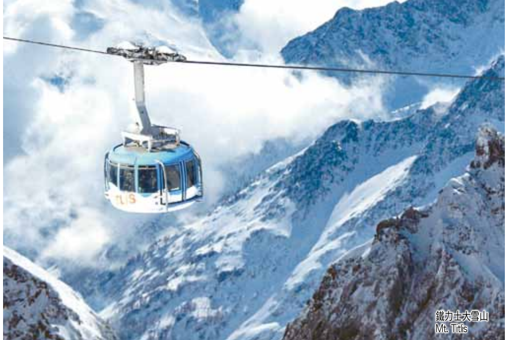
鐵力士大雪山 Mt. Titlis