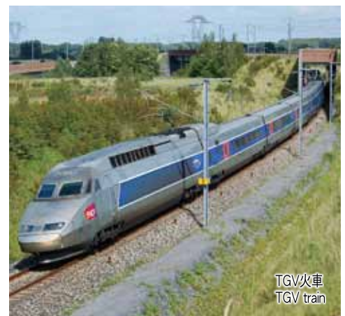
TGV火車 TGV train