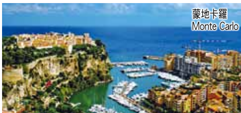
蒙地卡羅 Monte Carlo

住宿：Quark Hotel 或同級。 (早、晚餐) A revolving lift will take all to Mt Titlis for a magnificent view of the morning mountain. Shopping in Milan after visiting the Cathedral will be the highlight in the afternoon. Dinner will be served after 7 pm. (B/D)