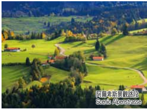
阿爾卑斯景觀路段 Scenic Alpenstrasse