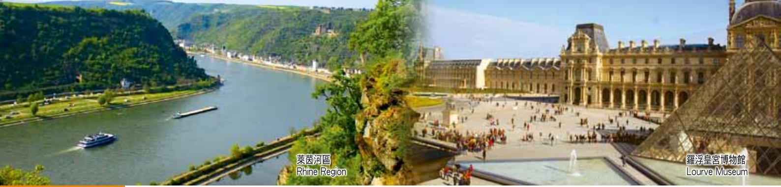
萊茵河區 Rhine Region