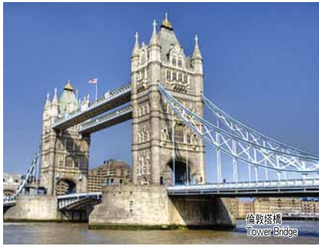
倫敦塔橋 Tower Bridge

是日搭乘豪華客機飛往法國首都—巴黎。 Depart from home city for Paris, the capital of France.