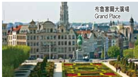
布魯塞爾大廣場 Grand Place