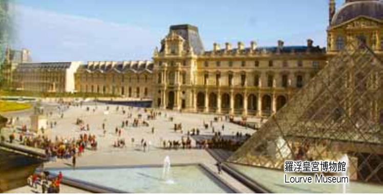
羅浮宮博物館 Louvre Museum

Visiting: France, Luxembourg, Germany, Netherlands, Belgium, England